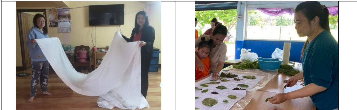
อาชีพทำผ้า ECO PRINT