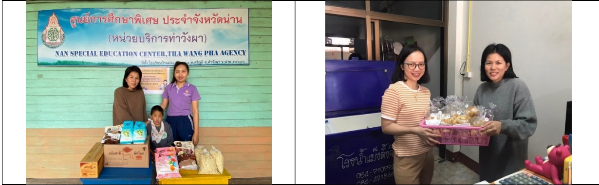
อาชีพทำขนมส่งขาย