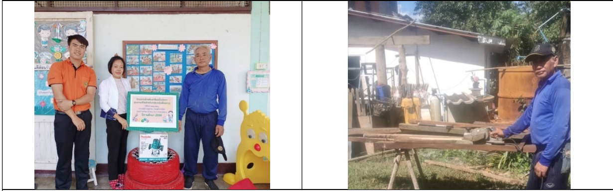
อาชีพก่อสร้างรับจ้างทั่วไป